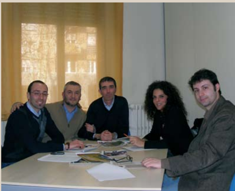
Alcuni membri della nuova redazione